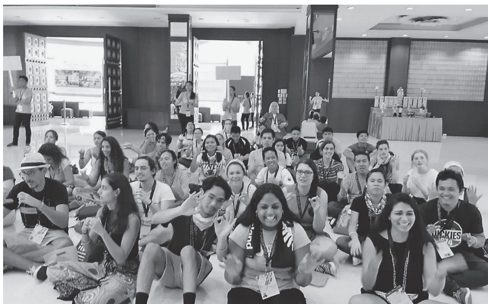
佛光緣馬尼拉館為藝術家與美術愛好者提供了分享美的寬闊平台，尊重與平等、融和與包容，讓每個人的生命皆能綻放光彩。